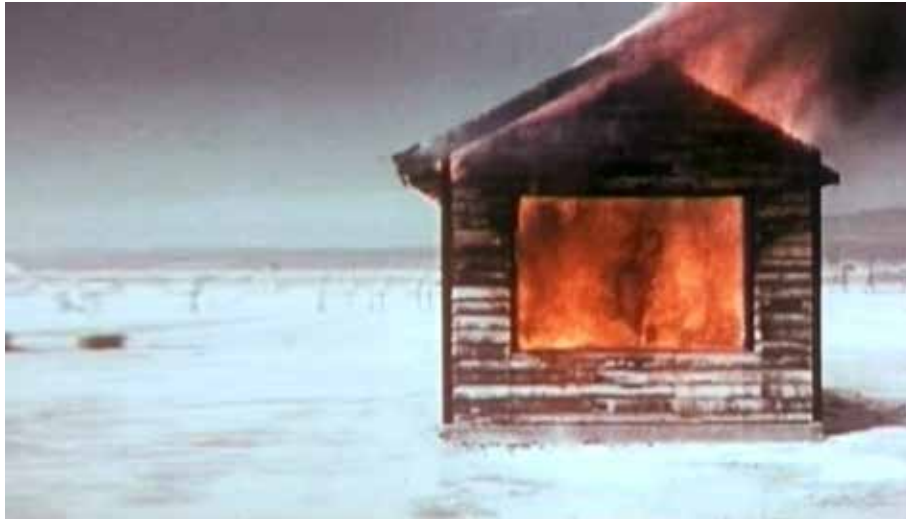
Mannaka No Ie (The House In The Middle) 7 min 50s, 2006