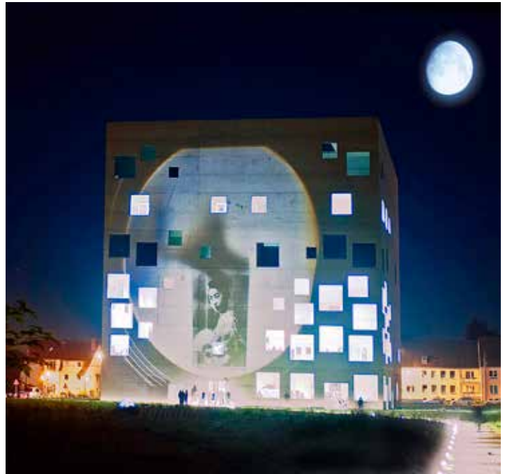
The Dream Of The Japanese Beauty, opening of the c.a.r. 09, the contemporary art Ruhr